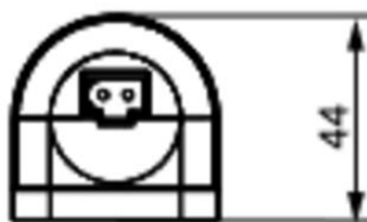
View of magnet fixing